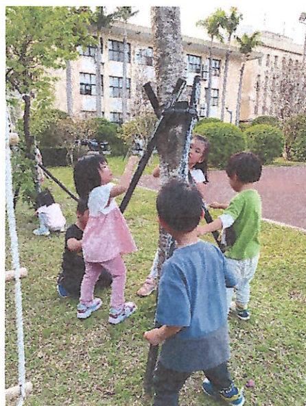
兒童藝術家:樹的彩繪