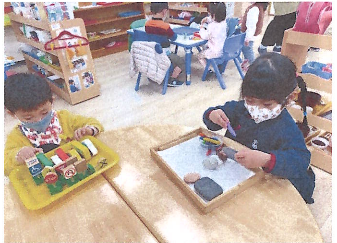
主題與學習區探索:數學、藝術