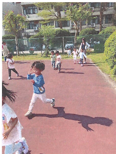
大肌肉活動:跑~跳~追