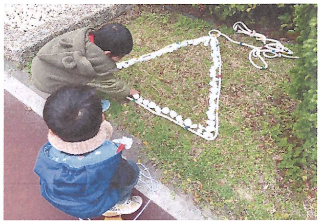
鬆散素材:石頭排列點、線、面構成圖