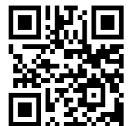
臺北市校園繳費系統

進入繳費期程(9月、2—3月)後，家長可進入上方繳費系統察看繳費資訊。或可下載酷課 APP 有更多更完整的其他功能