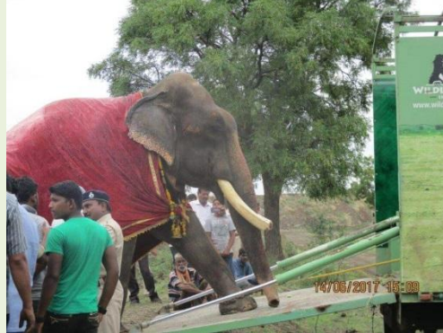
上圖：Gajraj 被鍊乞討受虐 51 年