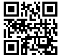
臺北市中山國小 QR Code